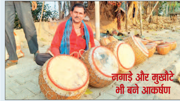
नगाड़े और मुखौटे भी बने आकर्षण