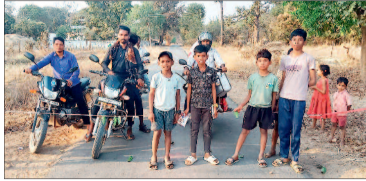
अनिमावक और स्थानीय जनप्रतिनिधि खामोश, प्रशासन पर सवाल

सवाल यह है कि आखिर इन बच्चों को इस तरह मौत के मुह में चंद पैसों के लिए धकेलने की जिम्मेदारी कौन लेगा। अगर किसी जगह पर होली चंदा लेते वाहनों द्वारा किसी बच्चे के